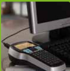
PC / Mac®