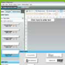
Software de etiquetas DYMO®