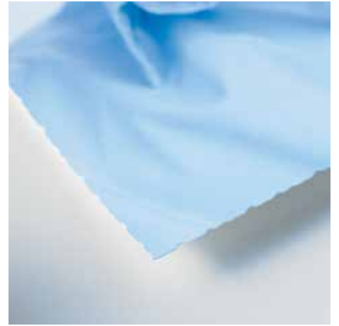
Canto de corte tipo papel de tina que ennoblece el papel